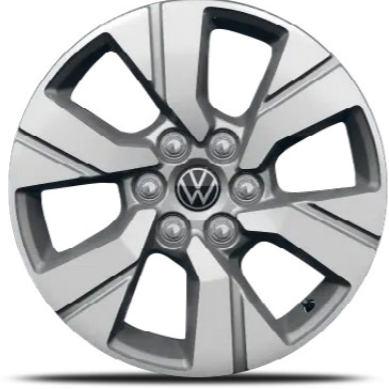
"Monte Carlo" 17 inç alüminyum alaşımli jantlar