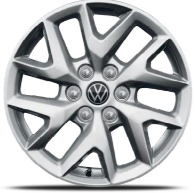
"Le Mans" 17 inç alüminyum alaşımli jantlar